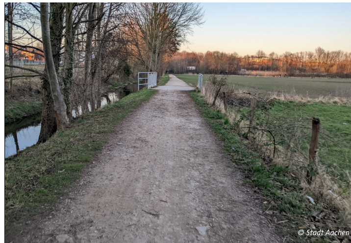
Abschnitt der RVR Haaren (Stand April 2022)