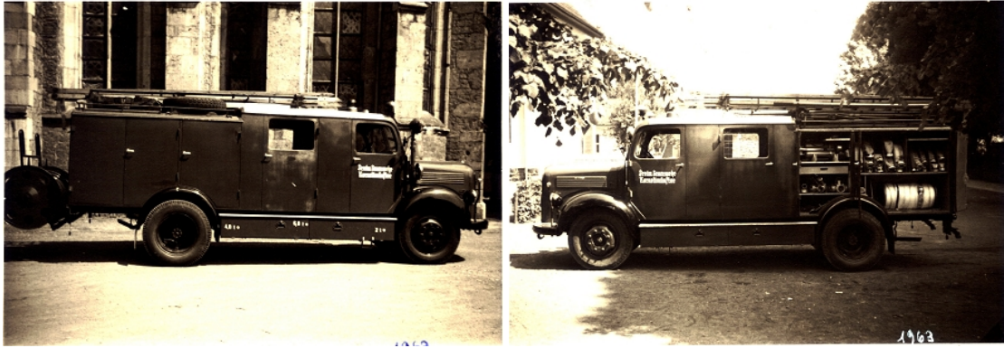
LF 8, 1963

Erfreulich war die Feststellung, dass sich immer mehr junge Leute für den Feuerwehrdienst interessieren, so dass die Wehr unter keinerlei Nachwuchssorgen zu leiden hatte.