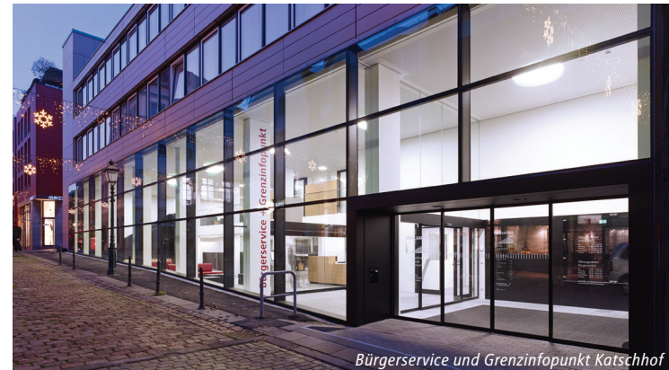
Bürgerservice und Grenzinfopunkt Katschhof

Als Gebäudemanager sind wir Bauherren, Eigentümer und technischer Betreiber. Gleichzeitig sind wir Auftraggeber und Partner für externe Architektur- und Ingenieurbüros, sowie insbesondere für die regionale Handwerkerschaft.