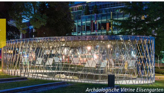
Archäologische Vitrine Elisengarten