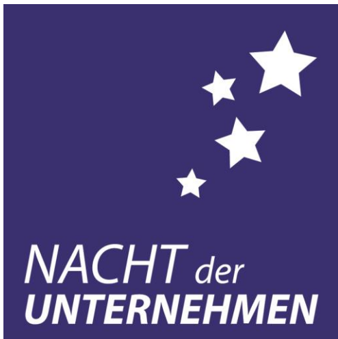
Logo „Nacht der Unternehmen“

Gerne stellen wir Ihnen die beigefügten Illustrationen auch in hoher Auflösung zur Verfügung.