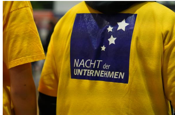
Nacht der Unternehmen

Bei Veröffentlichung bitten wir um einen Hinweis oder ein Belegexemplar an bleimann@tema.de