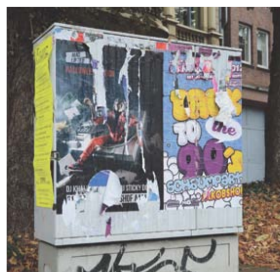
Stromkästen sollen auch weiter Plakatflächen bleiben – aber anders.