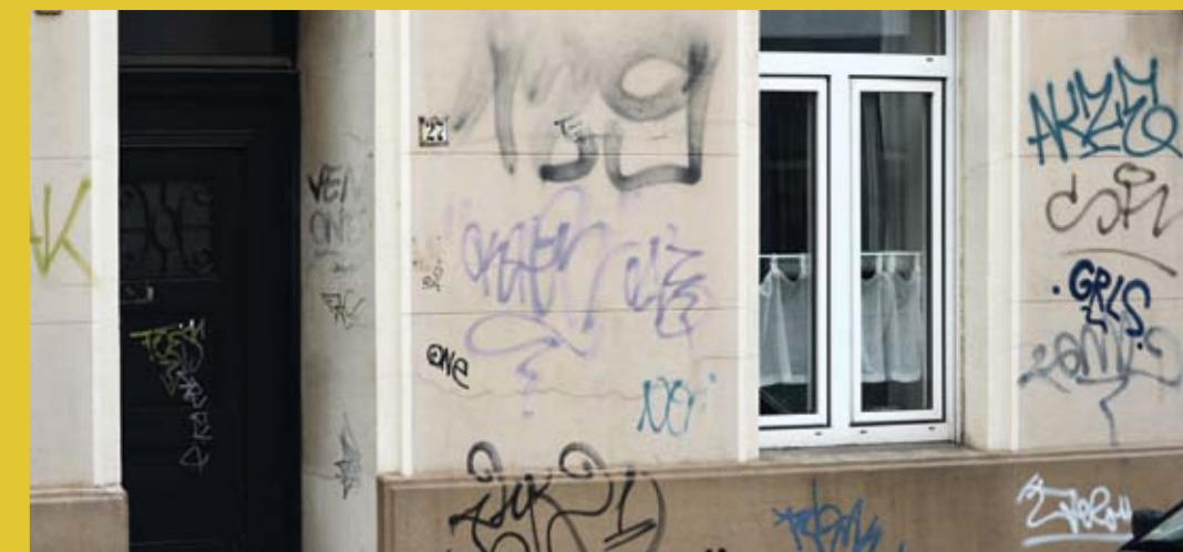
Muss nicht so bleiben: Für die Entfernung von Graffitis gibt es Zuschüsse der Stadt.