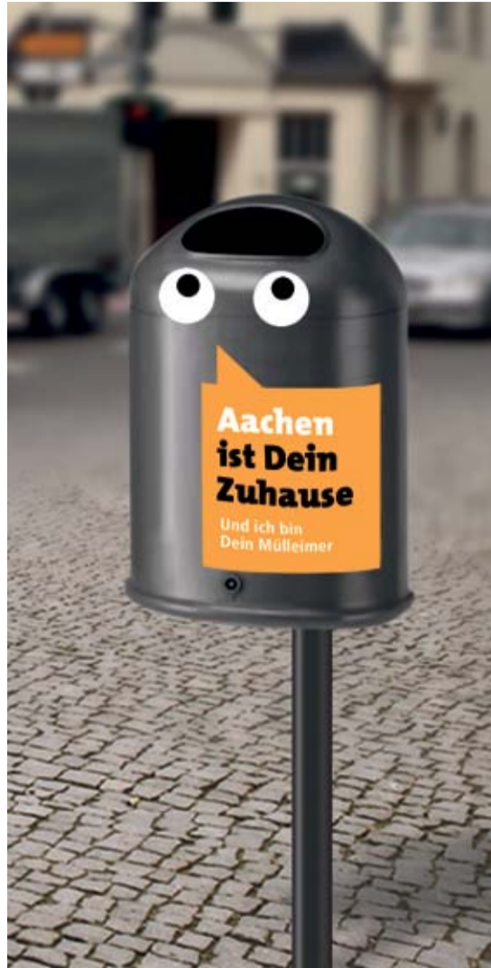
Zum Stehen und zum Hängen: Diese zwei Modelle sollen nach und nach mehr Einheitlichkeit bringen. Das hängende Modell bittet sogar freundlich um Müll.

Es gibt sie in quasi allen Formen und Farben: Papierkörbe. Die willkürliche Farb- und Formenvielfalt von früher ist in Aachen jedoch abgeschafft. „Orangefarbene Kunststoffpapierkörbe gibt es in Aachen vielleicht noch zehn Stück, die anderen haben wir längst eingezogen und ersetzt“, weiß Dieter Bohn, Leiter der Stadtreinigung im Aachener Stadtbetrieb. Es soll künftig nur noch ein ovales Hängemodell geben, anthrazit, entweder mit oder ohne Ascheraufsatz. Dazu gibt es noch ein rundes Standmodell.