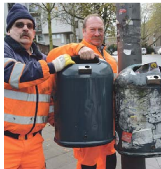
Klebrige Sache: Zugepaptete Mülleimer werden getauscht und aufgearbeitet.

Vier Mann des Stadtbetriebs sorgen für saubere Papierkörbe