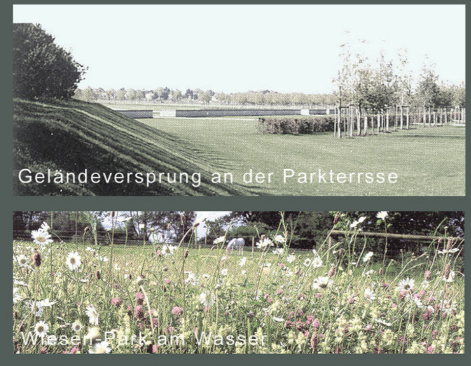
Geländeversprung an der Parkterrasse