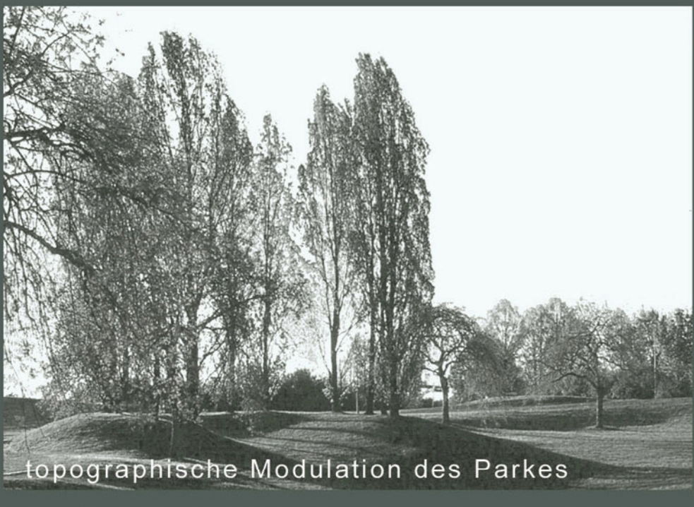
topographische Modulation des Parkes