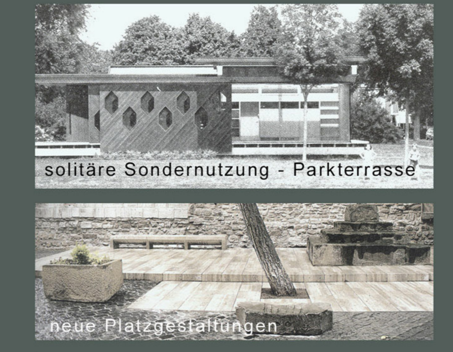
solitäre Sondernutzung - Parkterrasse