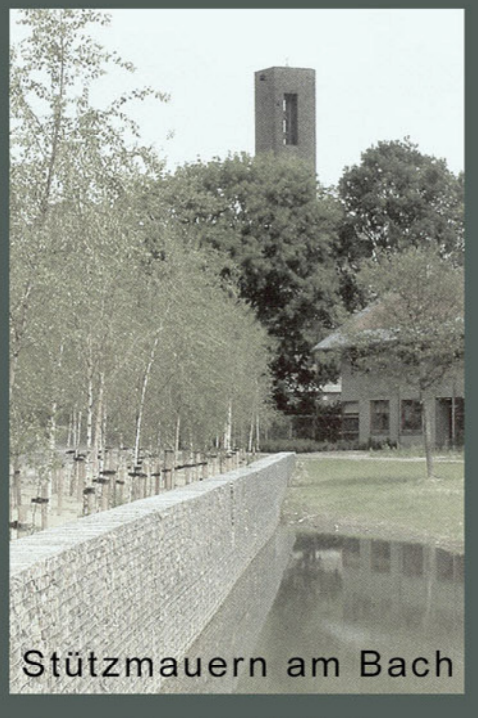
Stützmauern am Bach