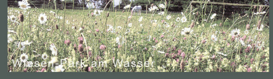
Wege am Wasser