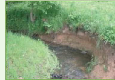
Prall- und Gleithang