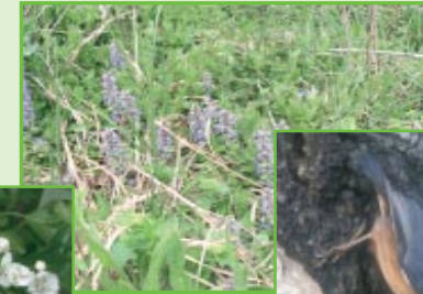
Kriechender Günsel