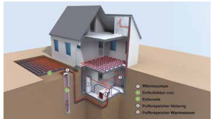
Funktionsweise Sole-Wasser-Wärmepumpe: Erdkollektor und Erdsonde sind hier beide dargestellt.