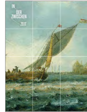
Instagram-Kampagne zur Schließungsphase (Entwicklung und Umsetzung; FB Kommunikation und Stadtmarketing)