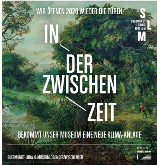
Hausbanner an der Museumsfassade weist auf den Grund der Schließung hin