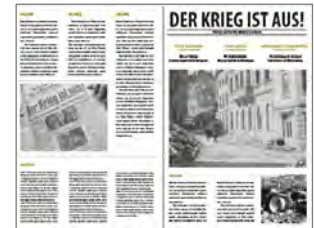
Gemeinsames Plakat der Ausstellungstrias und das Plakat der Ausstellung im Couven Museum; „Zeitung“ als gemeinsamer Flyer der drei Ausstellungen.