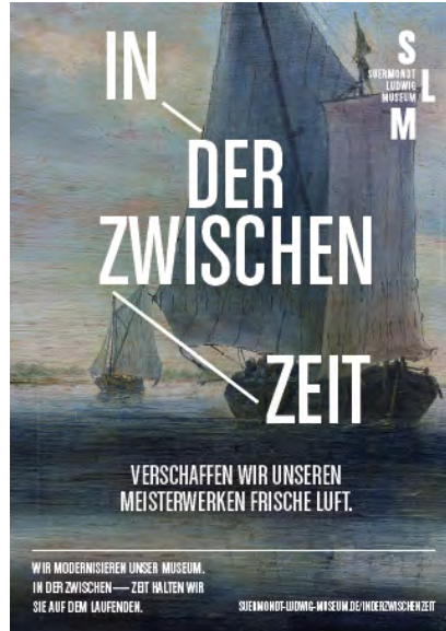
CityLight-Poster-Kampagne zur Schließungsphase