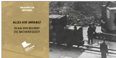
Einladungskarte des Centre Charlemagne zu „Alles auf Anfang“