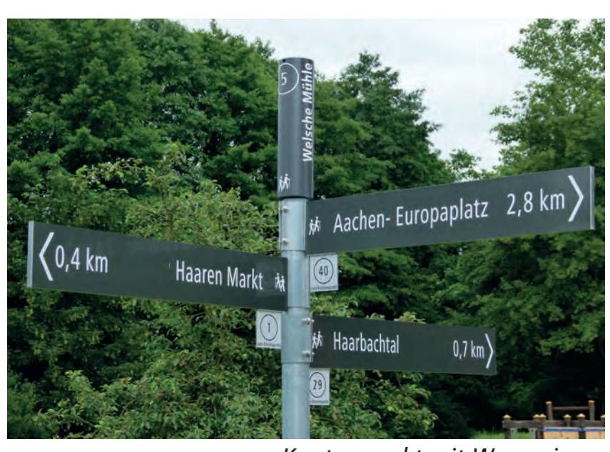
Knotenpunkt mit Wegweisern

Die Rettungspunkte im Bezirk Haaren tragen eine elfstellige Standortnummer , die einheitlich mit 049-10-02-00 .. beginnt. Die zweistellige Endziffer des jeweiligen Standorts ist auf der Orientierungskarte zu finden.