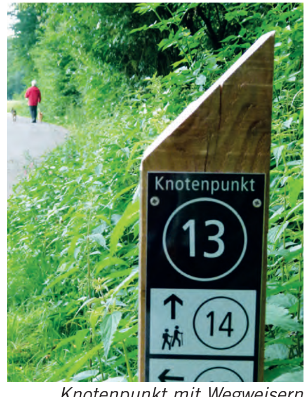
Knotenpunkt mit Wegweisern