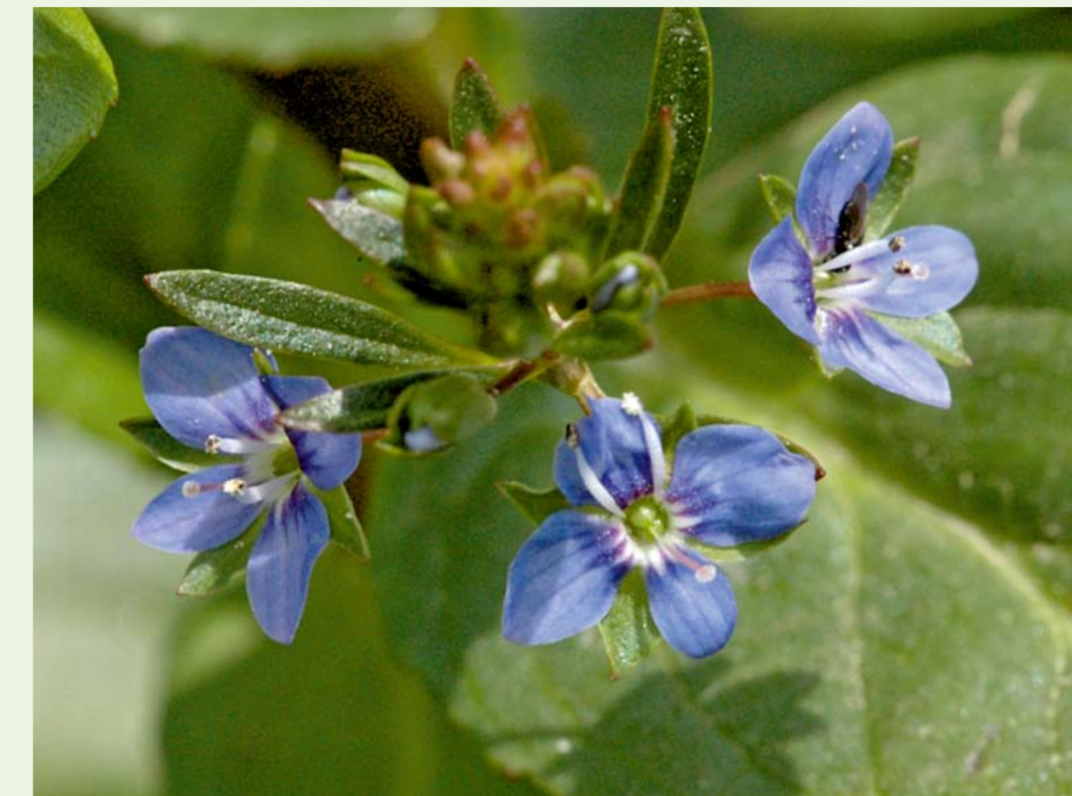
■ Bachbunge ( Veronica beccabunga )

Zur Pflanzenwelt des Feuchtgebietes und der angrenzenden Wiesen zählen Bachquellkraut, Sumpfschachtel-