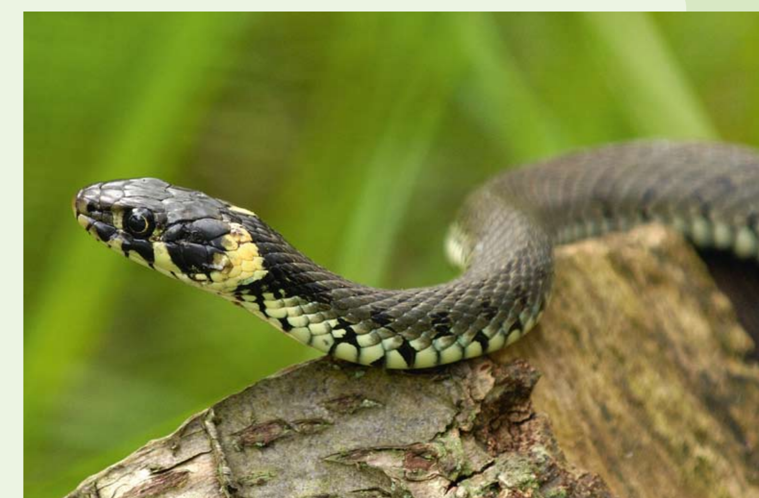
■ Ringelnatter ( Natrix natrix )

zerstört wurden. Die Wiesen östlich der Lütticher Straße weisen übrigens teilweise noch ähnliche Bedingungen wie im hier als Naturschutzgebiet geschützten Feuchtgebiet auf und sind als Landschaftsbestandteil unter Schutz gestellt.