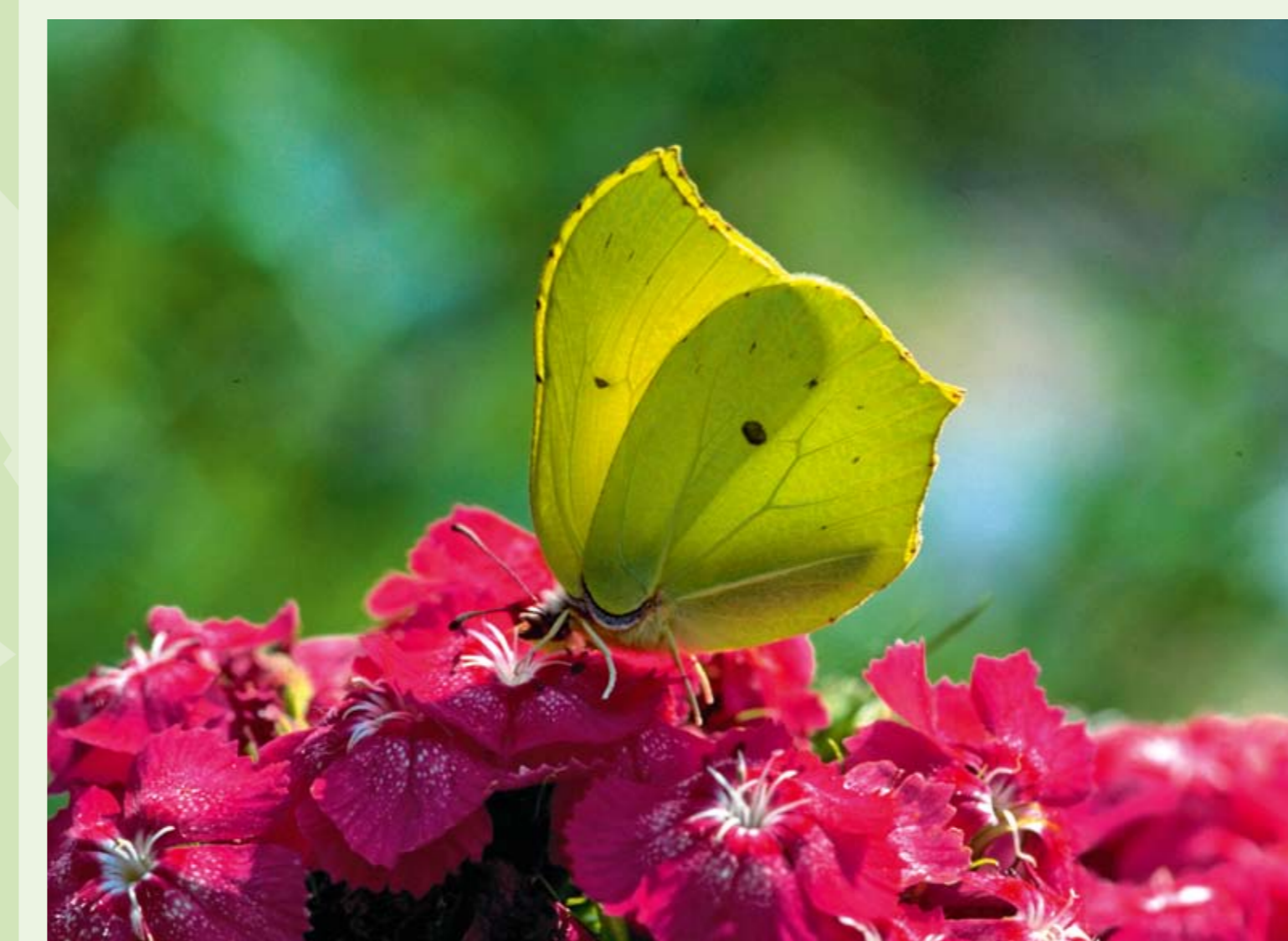
■ Zitronenfalter ( Gonepteryx rhamni )

Nördlich des Feuchtgebietes schließt sich ein Waldgebiet an, in dem ebenfalls eine Reihe wertvoller und schützenswerter Pflanzen heimisch sind. Neben einem Birkenbruchwald befindet sich hier ein weitgehend offenes Großseggenried – eine ehemalige Nasswiese mit vorwiegend hochwüchsigen Seggen (Sauergrasgewächsen). Ebenfalls recht selten ist der Bestand des etwa 150 Jahre alten Erlenbruchwalds mit Eichen.