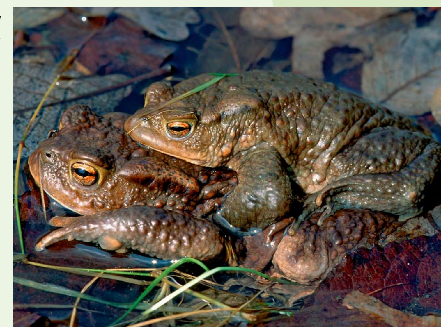
■ Erdkröten ( Bufo bufo )