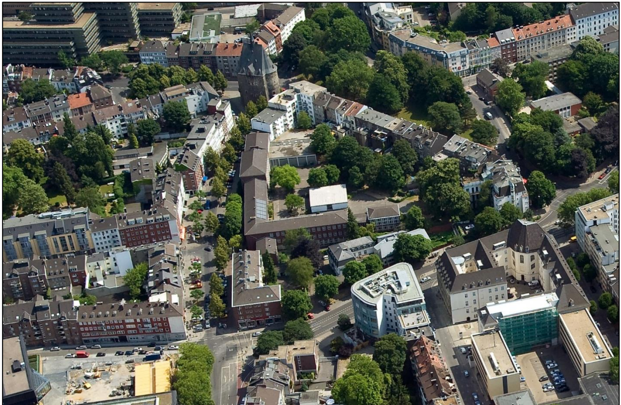
Abb. 1: Umgebung des Plangebietes

Das Plangebiet ist heute straßenbegleitend mit der 3-4-geschossigen ehemaligen Hauptschule bebaut. Die Sporthalle und der unmittelbar nördlich angrenzende Gebäudeteil werden nicht in das Plangebiet einbezogen. Der vorgenannte Gebäudeteil soll zukünftig für die Kita genutzt werden. Das Schulgebäude besteht neben dem straßenbegleitenden Abschnitt aus einem ca. 65 m langen Seitenarm, der in die Tiefe des Plangebietes errichtet wurde. Südlich des Gebäudewinkels befindet sich ein eingeschossiges Behelfsgebäude für die Kita Franzstraße. Die Flächen des Schulgrundstücks sind heute nahezu komplett versiegelt.