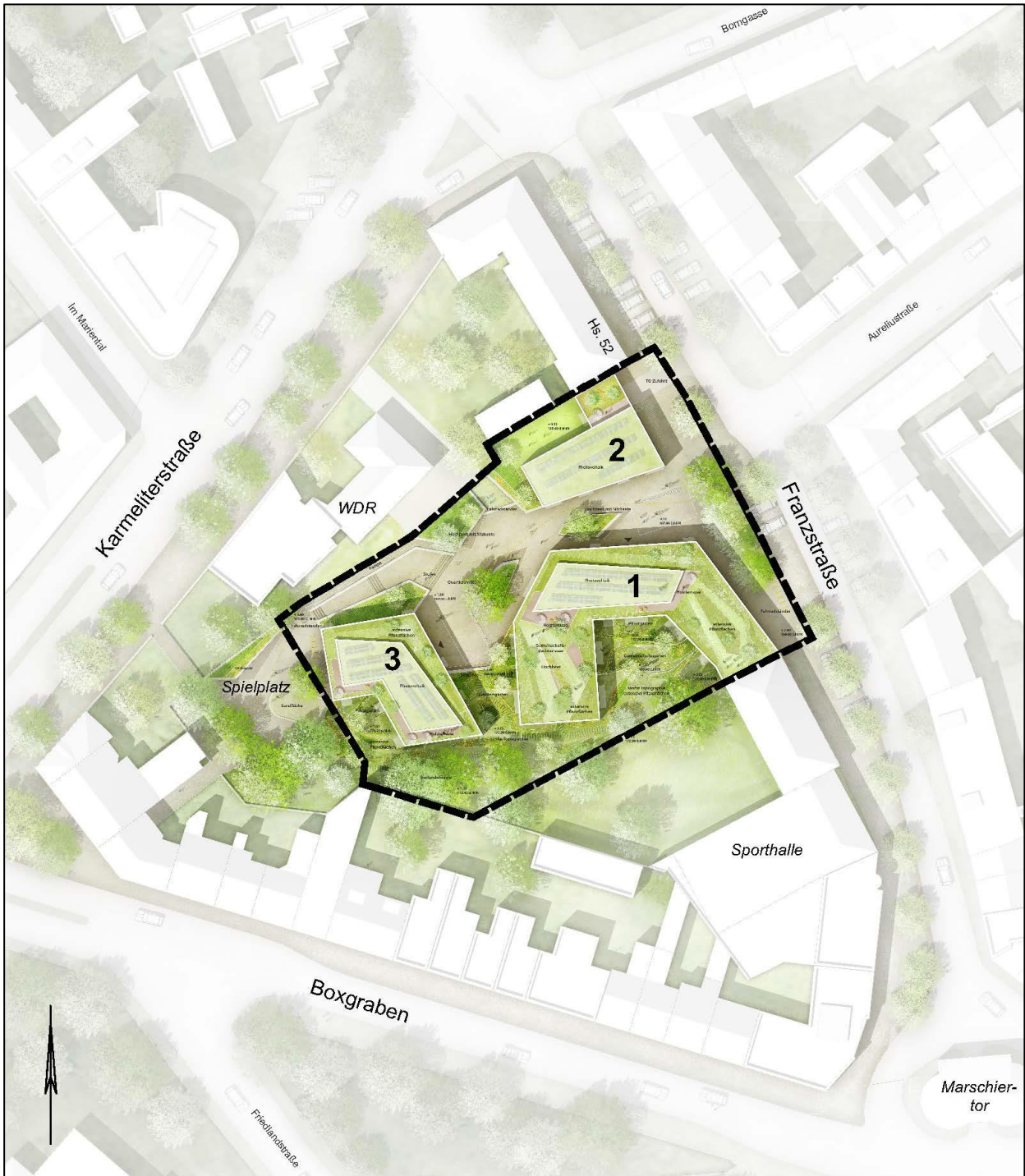
Abb. 2: Städtebauliches Konzept

topographischen Situation entstehen im Freiraum unterschiedliche Plateaus, die die Anwohner und Passanten über Rampen und Freitreppen von der Franzstraße aus über die Quartiersmitte Richtung Spielplatz und Karmeliterstraße / Boxgraben lenken. Diese Bewegunglenkung wird durch die Gebäudekonturen unterstützt. Die einzelnen Platzflächen werden durch kleine Grünflächen aufgewertet und erzeugen eine eigenständige Freiraumqualität. Insgesamt entsteht eine spannungsreiche Abfolge von urban- und grünteprägt Platz- und Freiräumen.