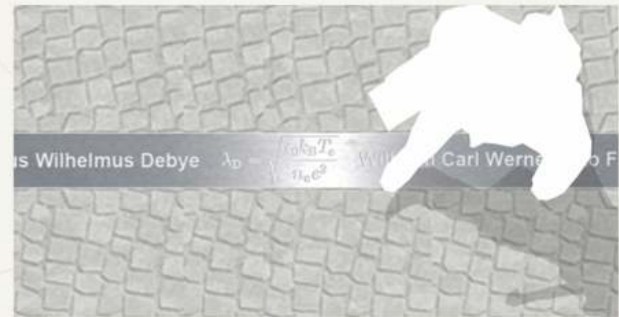
Sience Line am Tag