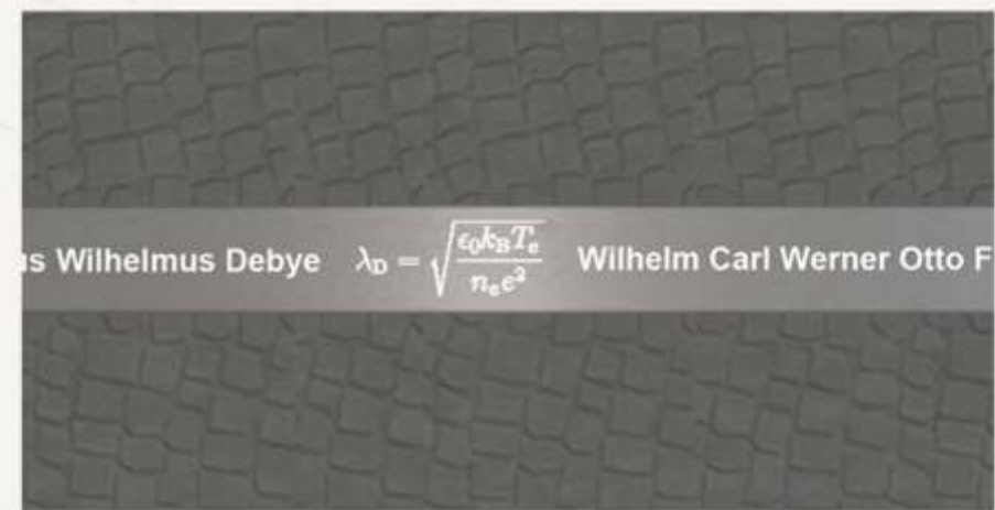
Sience Line bei Nacht

Gestalterisch formuliert und zusammengehalten wird der zentrale Campus durch ein überlagerndes Ordnungsprinzip (Campus patterns) das in Ausrichtung und Achsmaßen vom Hauptgebäude also dem Ursprungsbau der Hochschule ausgeht. Diese lineare Rasterung wird in verschiedener Weise interpretiert: in der Reliefausbildung mit steinernen Treppen und Rasenterrassen, der Bepflanzung und Möblierung, vor allem aber in seinem markant linierten Stadtboden: Tradierte und moderne Materialien werden darin zu einem vornehmen Teppich verwoben.