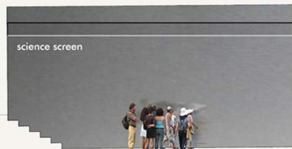
Science Screen - Kármán Forum