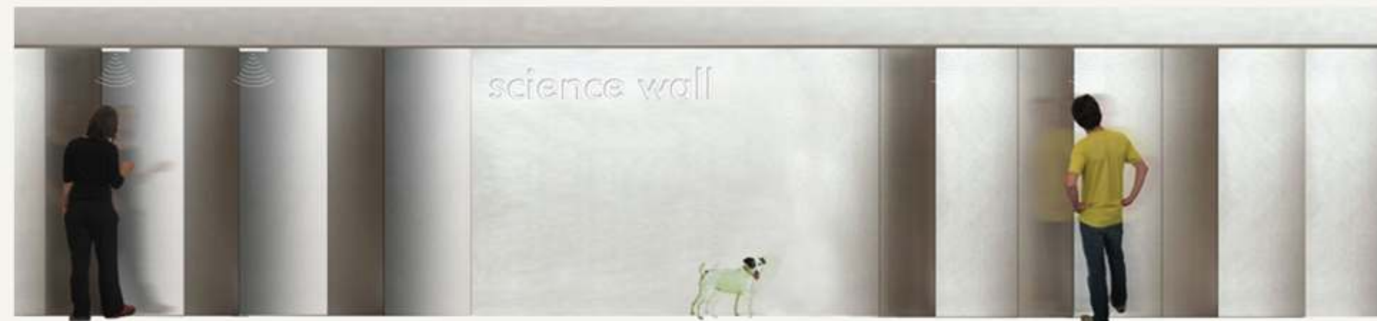
Science Wall - Bibliotheksgarten