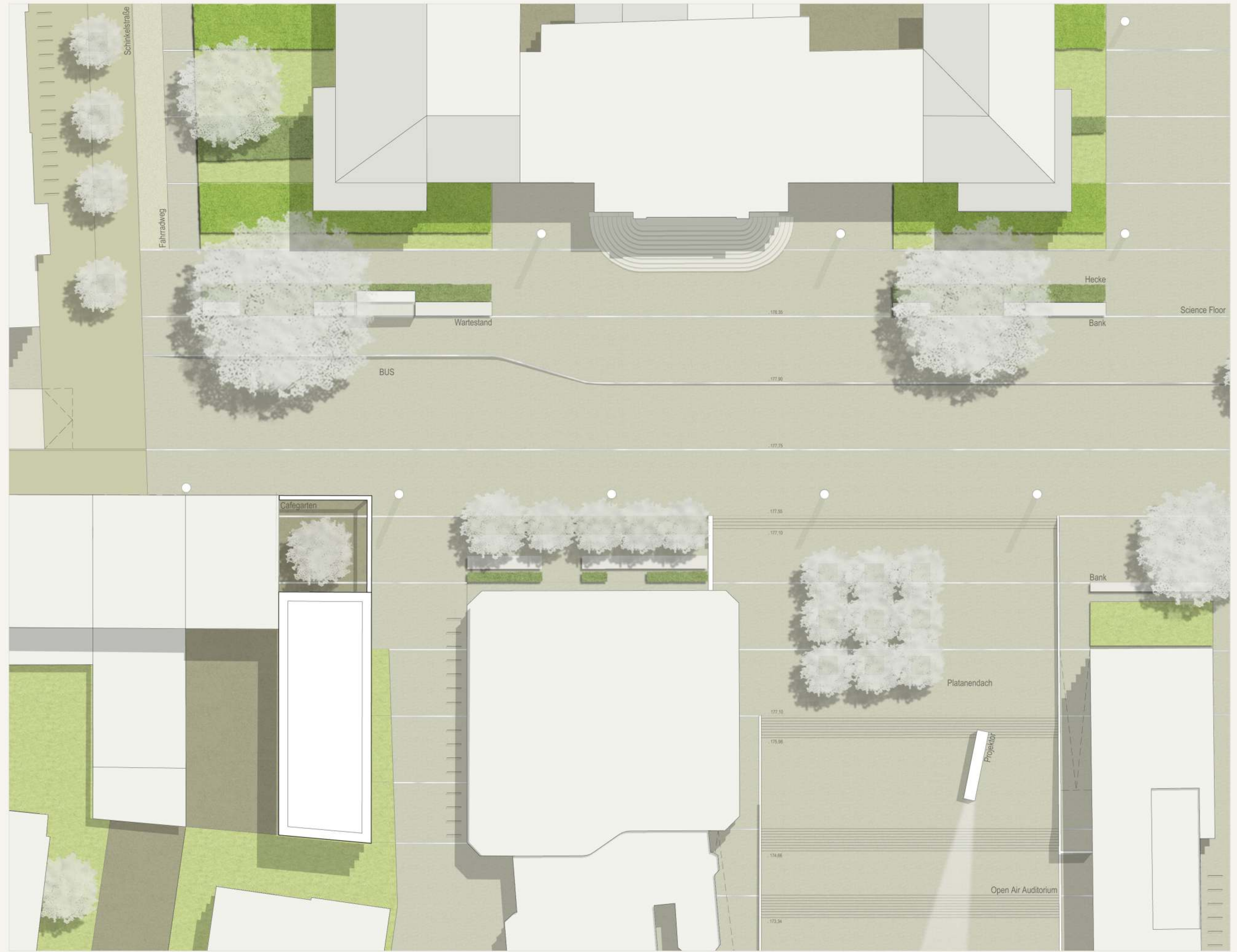
Detailausschnitt M. 1:250