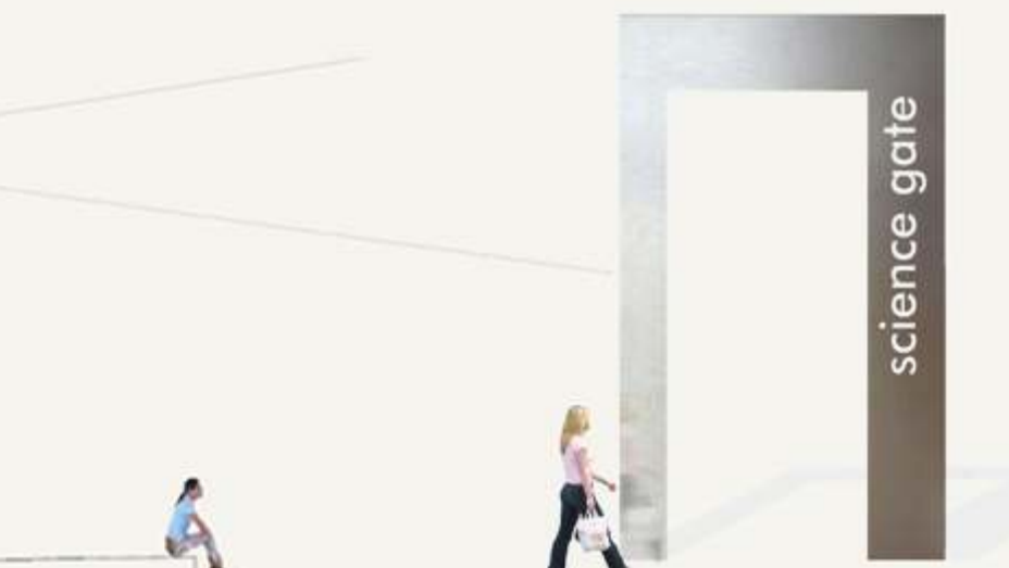
Science Gate - Kármán Forum