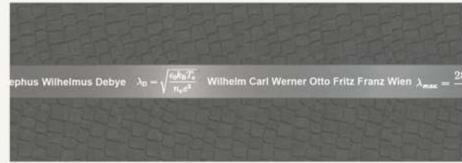
Science Floor bei Nacht - Templergraben

Das Konzept der Achse der Wissenschaft und der Gedanke einer ideellen Verknüpfung der Orte werden aufgenommen. Die vorgeschlagenen „Science Signs“ sind dabei mehr als Möblierung des Stadtraums. Sie bestimmen Orte und werden zum integralen Motiv in der Gestaltung der Freiräume. Übergeordnetes Attribut der Signs ist die Verwendung des Materials Edelstahl. Dass sich in den Informationsträgern zum Thema Wissenschaft die Welt des Alltags widerspiegelt, wird zum Teil des Konzepts.