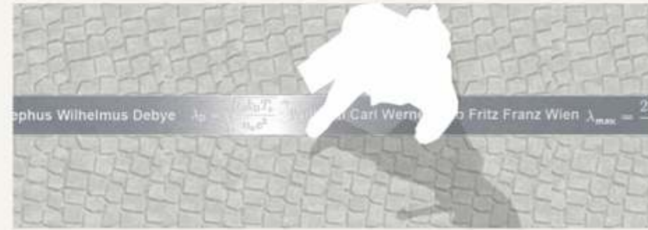
Science Floor am Tag - Templergraben