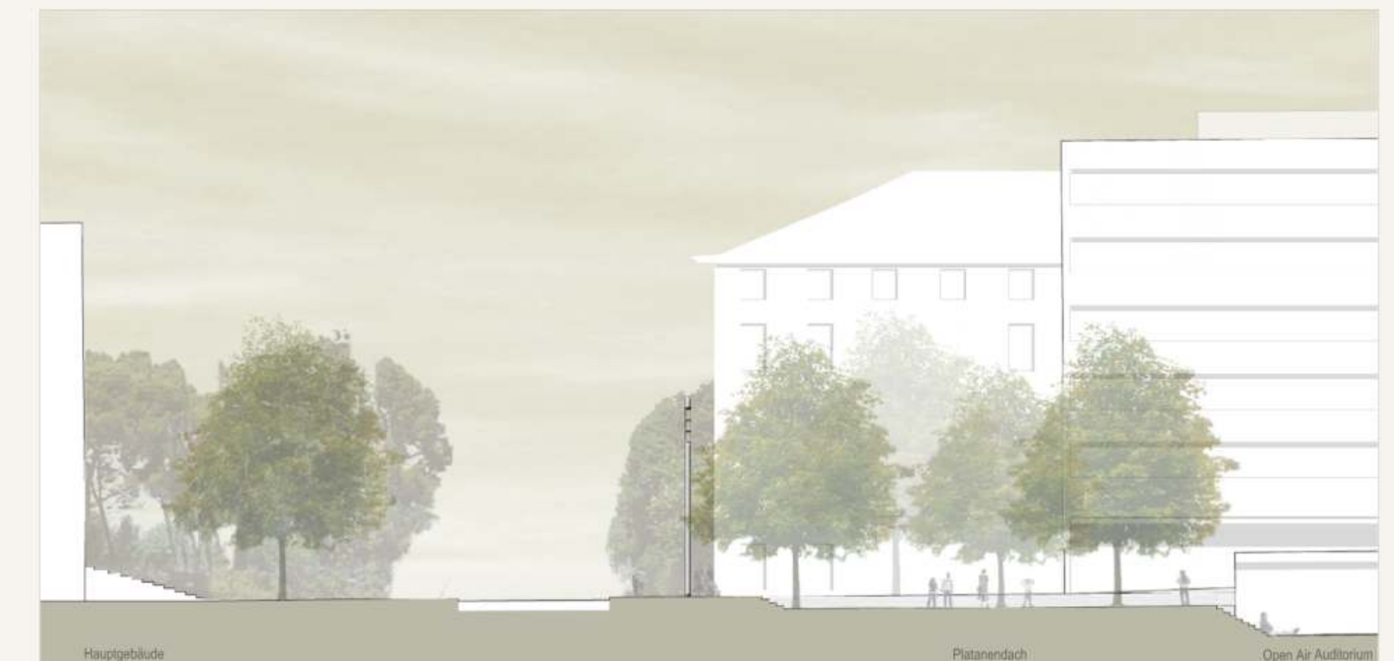
Schnitt "Universitäts-Forum" M. 1:250