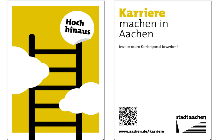
oben: Citycard und Postkarten sorgen für eine breite Streuung. unten: Der neue mobile Messestand kommt regelmäßig zum Einsatz.