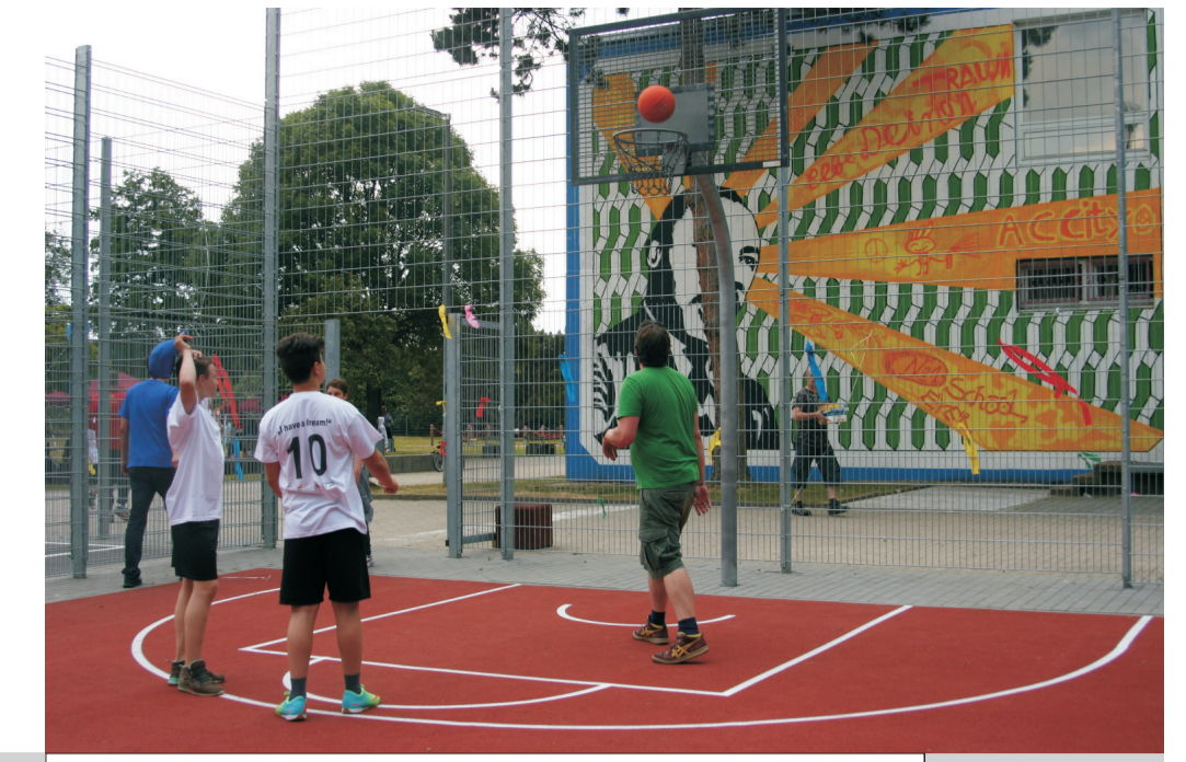
eingezäuntes Streetballfeld mit Tartanboden