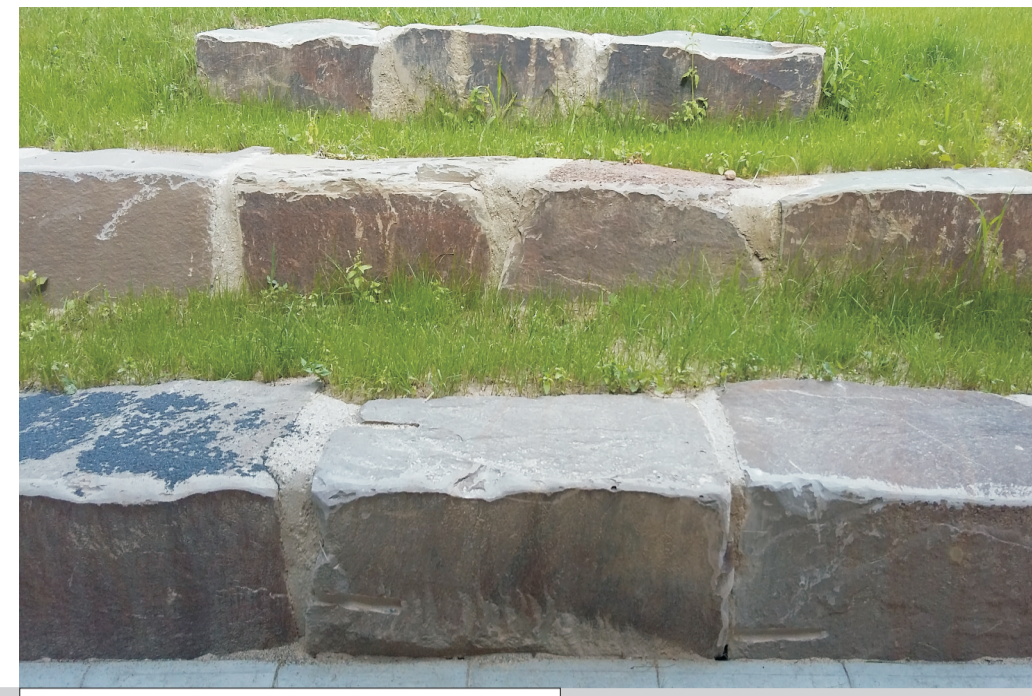
Einfassung mit Bruchsteinen