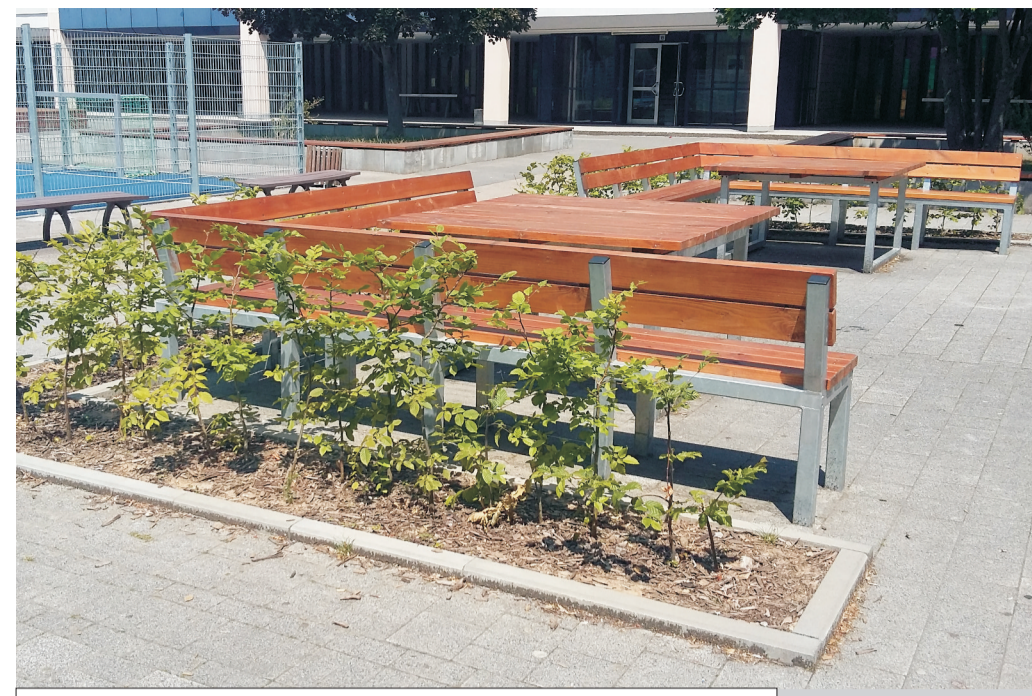
Tische und Bänke mit Hecken abgegrenzt