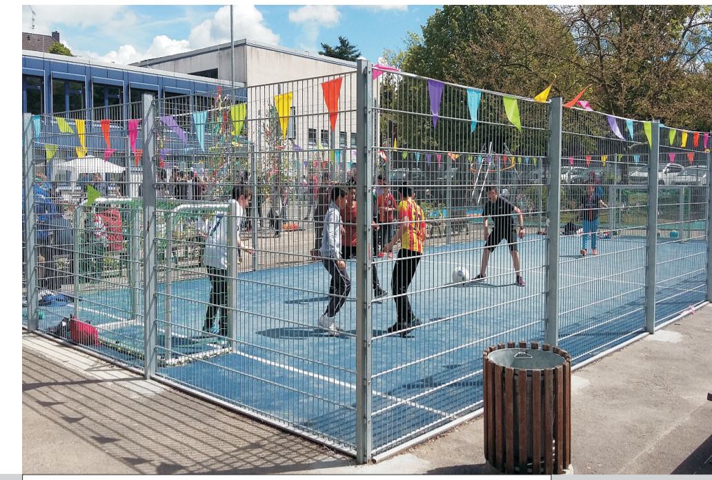
eingezäuntes Fußballfeld mit Teppichvlies