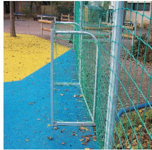
Fußballort mit Teppichvlies, blau