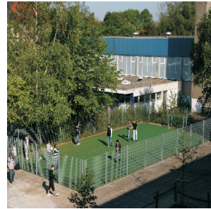
Fußballfeld mit Teppichvlies, eingezäunt