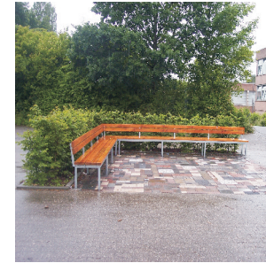
Sitzbänke mit Hecken