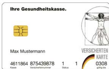
Muster einer Versicherungskarte

Liječnik onda izravno obračunava s vašim zdravstvenim osiguranjem. Koje je usluge liječnik pružio i što je za njih računao, možete vidjeti na potvrdi za pacijenta , koju vam liječnik izdaje na vaš zahtjev.