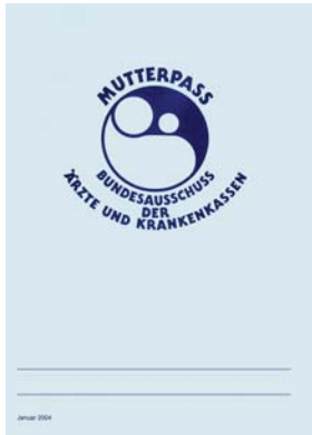
Mutterpass Deckblatt Materinska iskaznica, izgled korica izvana

Die Schwangere sollte den Mutterpass immer mit sich führen, damit ihr und dem werdenden Kind in einer Notsituation besser geholfen werden kann. Der Mutterpass muss bei jedem Arzt-, Krankenhaus- oder Zahnarztbesuch vorgezeigt werden. Bei Schwangeren dürfen nämlich viele Medikamente nicht verabreicht und manche Untersuchungen nicht durchgeführt werden.