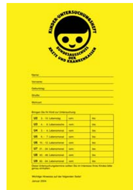
Knjižica za preventivne preglede djeteta

Pri rođenju djeteta dobiti ćete knjižicu za preglede djeteta. U njoj su navedeni svi preventivni pregledi do 64. mjeseca života: