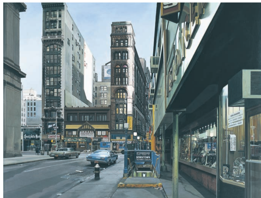
Richard Estes, Downtown, 1969, MUMOK, Wien