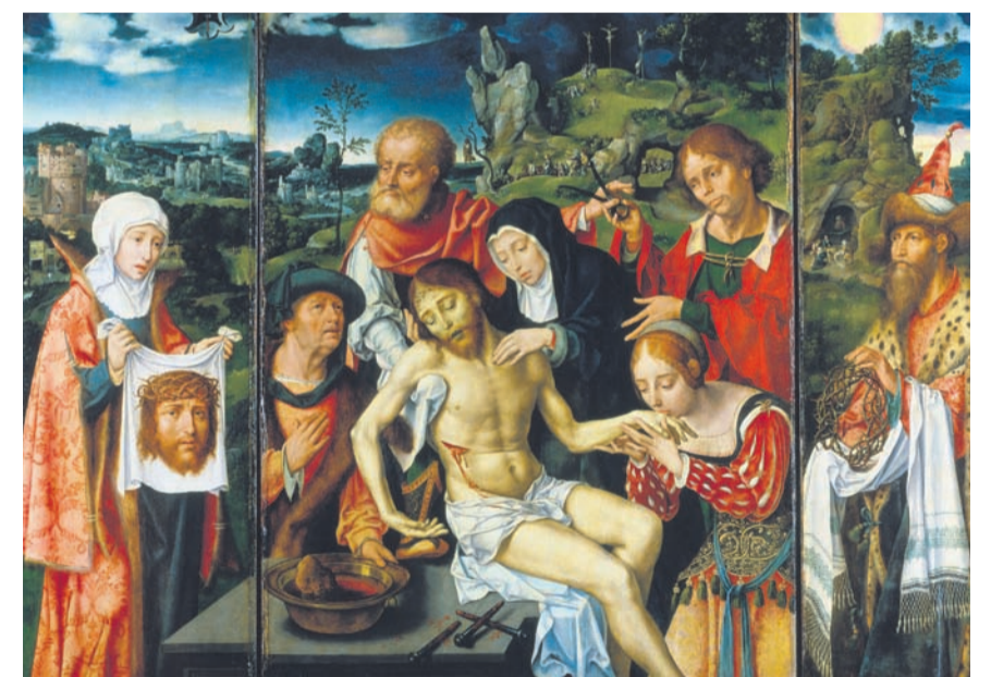
Joos van Cleve, Triptychon mit der Beweinung Christi, Frankfurt, Städel Museum

Eröffnung (öffentlich): Mittwoch, 16. März 2011 17 Uhr Ansprachen in der benachbarten Adalbertkirche, Adalbertsberg Ausstellung im Suermond-Ludwig-Museum zugänglich ab 17 Uhr (Eintritt frei)