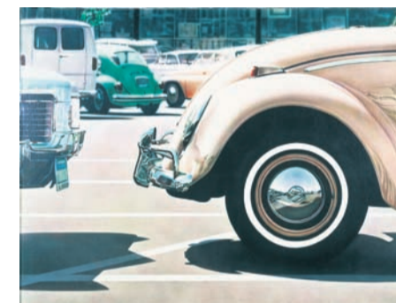
Don Eddy, Untitled (Volkswagen), 1971, MUMOK, Wien, © Don Eddy

„Hyper Real“ ist nicht nur das erste gemeinsame Ausstellungsprojekt mehrerer internationaler Sammlungsstätten aus der Familie der Ludwig-Sammlungen (mit dem Museum Moderner Kunst Stiftung Ludwig MUMOK in Wien und dem Ludwig Müzeum in Budapest). Sie ist auch eine gemeinsam von den Kulturstiftungen des Bundes und der Länder geförderte Ausstellung. Überdies tragen die Peter-und-Irene-Ludwig-Stiftung und die Stadt Aachen mit ihrer Unterstützung zur Größe und überregionalen Strahlkraft der Schau bei.