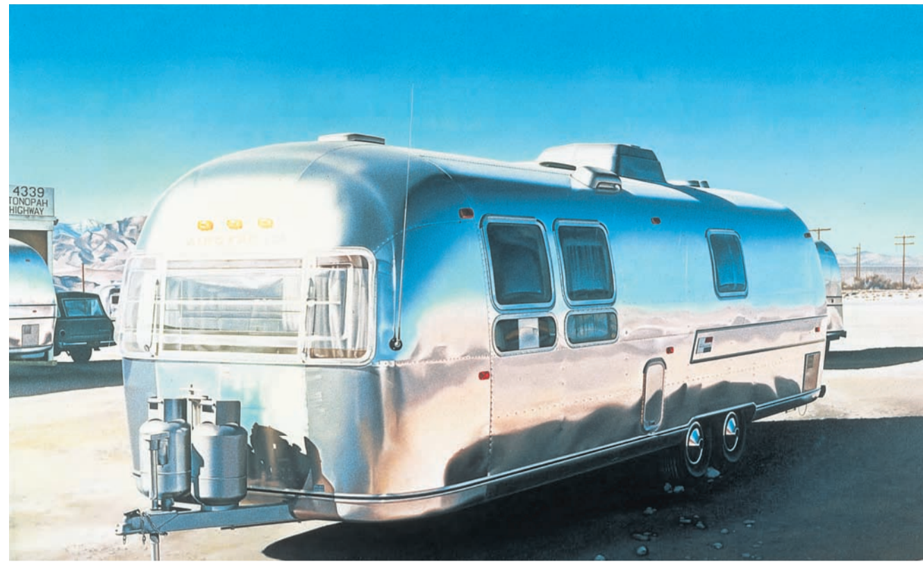
Ralph Goings, Airstream, 1970, MUMOK, Wien, © Ralph Goings; Foto: MUMOK