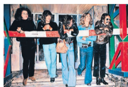
Franz Gertsch, Medici, 1971, Ludwig Forum, Aachen, © Franz Gertsch, Foto: Ludwig Forum Aachen/Anne Gold