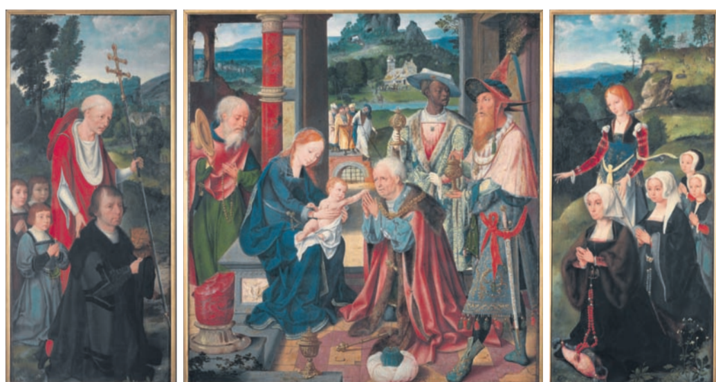
Joos van Cleve, Triptychon mit der Anbetung der Könige, National Gallery, Prag

Schuldidaktik: Das Suermondt-Ludwig-Museum bietet begleitend zur Ausstellung ein umfangreiches didaktisches Programm für Schulklassen aller Altersstufen. Infos unter Tel. +49(0)241-47980-20 oder renate.szatkowski@mail.aachen.de .